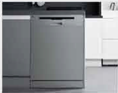
2 기존의 싱크장에 들어가도록 설치해 드립니다. (싱크장 하단의 걸레받이 일부 절단)