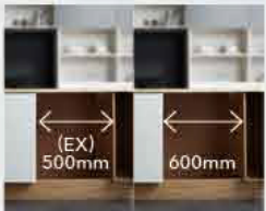
1 가까운 가구사에 의뢰하여 싱크장 리폼공사를 진행하세요. (고객님 선택 사항)

사이즈가 맞지 않을 경우(W600mm 싱크장이 없을 때 슬림형은 450mm)