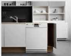
2 싱크장 리폼 공사가 끝난 뒤, SK매직 기사님이 다시 일정에 맞춰 제품을 설치해드립니다. (설치비 무료)