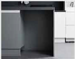
1 설치 기사님이 현재 사용 중인 싱크장을 분리합니다.