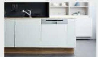
4 도어판넬이 미리 준비되어 있으면, 설치기사님이 제품에 부착해드립니다. (무료)