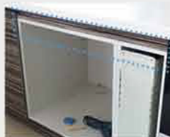
표준 싱크장 공사비용(SK매직 설치 마스터 시공)