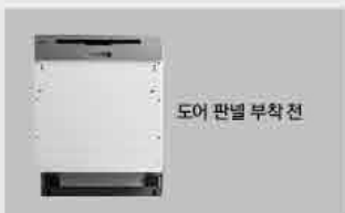
도어 판넬 부착 전